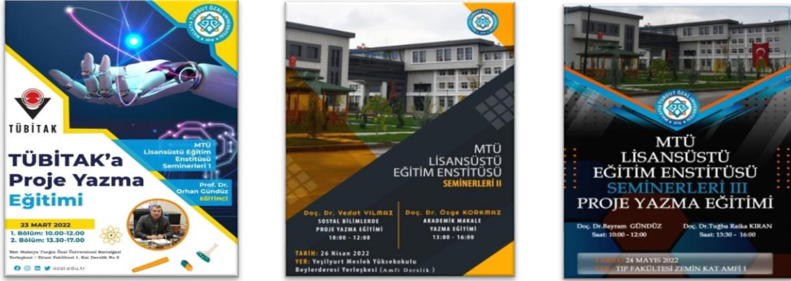
Şekil 3. Proje ve Akademik Makale Yazma Eğitimleri