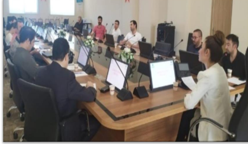
Şekil 2. Dış Paydaş Değerlendirme Toplantısı